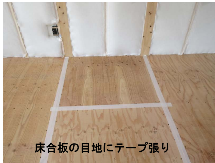
床合板の目地にテープ張り