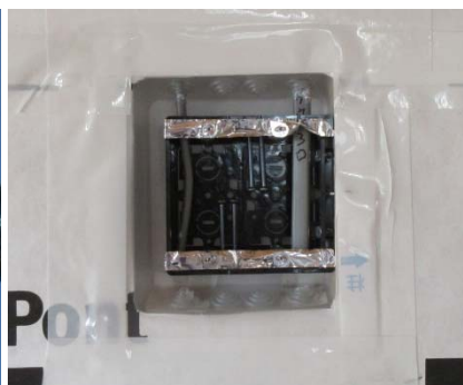
気密コンセントボックス