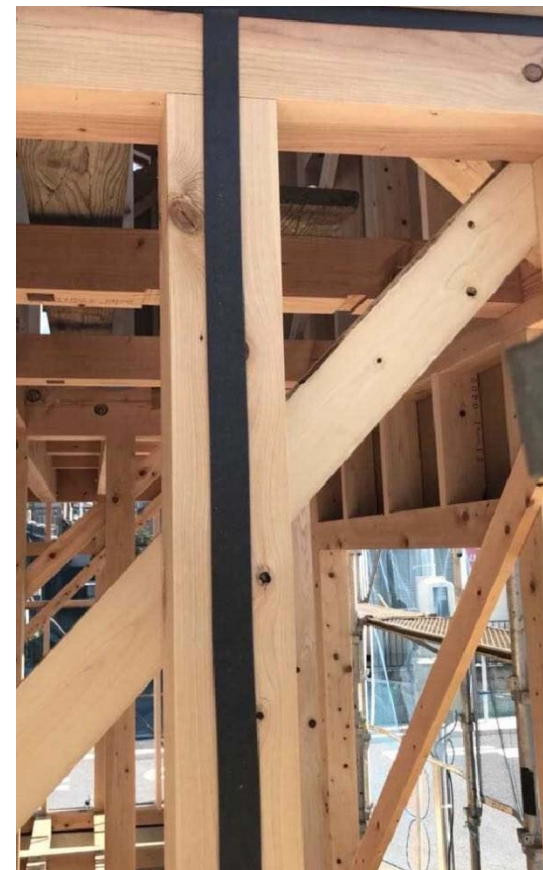
構造面材の継ぎ目にPEパッキン張り