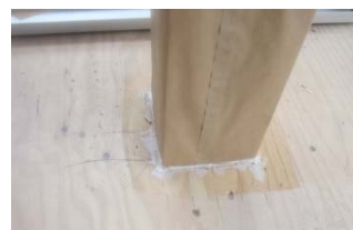
柱かきこみにシーリング