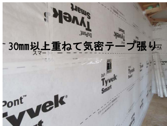
30mm以上重ねて気密テープ張り