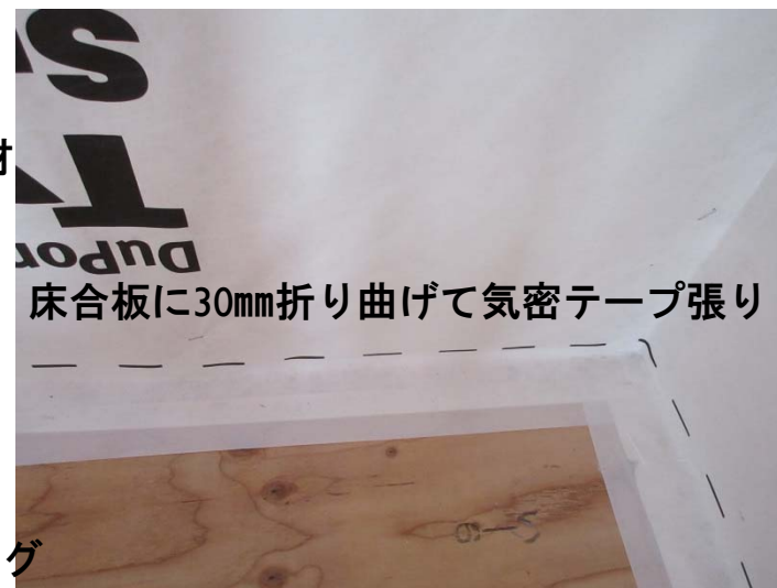
床合板に30mm折り曲げて気密テープ張り