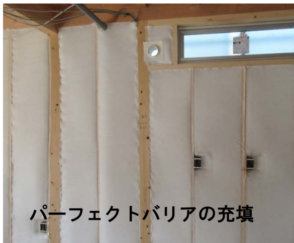
パーフェクトバリアの充填