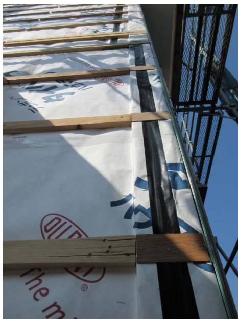
外部の透湿防水シートに気密テープ張り