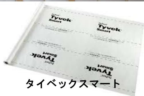
タイベックスマート