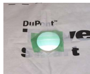
専用プラスチック部材