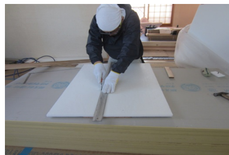
④断熱マットをカッターでカットする