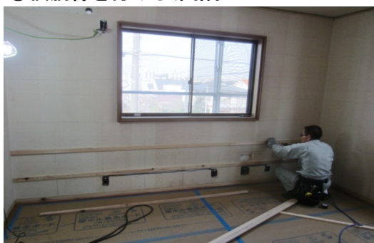
⑤横胴縁を付ける(間隔は455mm~303mm)