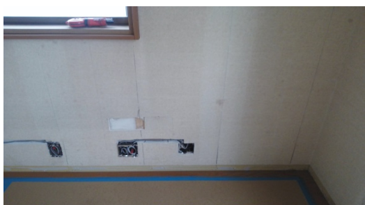
③コンセントの移動