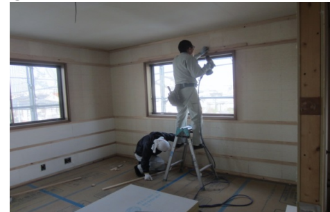
⑦カーテンレール下地を付ける